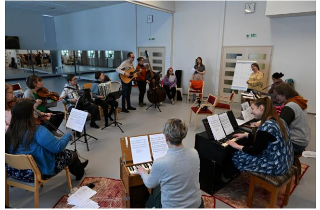
Talvijamit helmikuussa 2023 Kaustisella.

Talvijamit-kurssi järjestettiin yhteistyössä Step-koulutuksen kanssa. 12 kansanmusiikista ja kansantanssista kiinnostunutta henkilöä osallistui Talvijameihin, eli viikon mittaiselle kurssille 20.-24.2.2023 Kaustisella, jonka aikana osallistujat tutustuivat kaustislaiseen elävään perintöön. Koulutuksen tavoitteena on lisätä tietoa ja tietoisuutta kaustislaisesta viulunsoittoperinteestä ja sen eri ilmenemismuodoista, ja testata samalla mahdollista kulttuuri- matkailutuotetta pienelle ryhmälle.