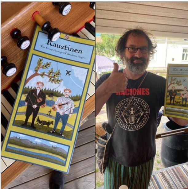
Kaikuma-hankkeessa tuotettu viulunsoitto -esite.